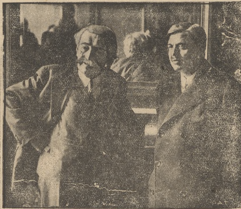
Na zdjęciu Briand i Laval w wielkim salonie ministerstwa spraw zagranicznych w Paryżu w chwili po zdaniu urzędowania Lavalowi przez Brianda.