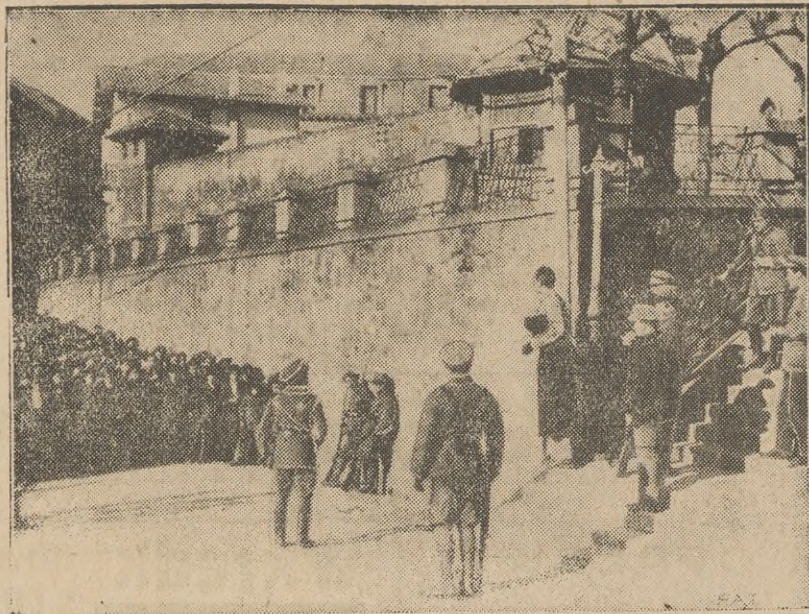
W Bilbao, stolicy hiszpańskiej Biskajii wybuchły w ostatnich dniach zaburzenia na tle tarc pomiędzy rojalistami i republikanami. W czasie walk trzy osoby zginęły, 40 zostało ciężko rannych. Na ilustracji tłum demonstrujących, zebranych przed więzieniem i domagających się uwolnienia więźniów.