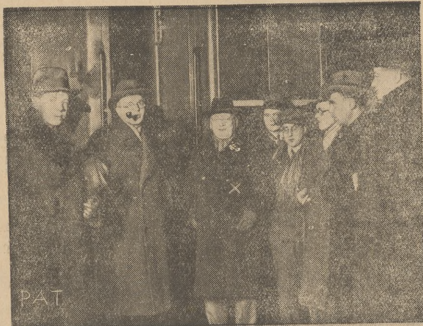
Przed kilku dniami przejechał przez Warszawę w drodze na konferencję rozbrojenową w Ge-ZSRR. Litwinow. Zdjęcie przedstawia Litwinow (x) w otoczeniu urzędników poselstwa ZSRR, na dworcu głównym w Warszawie.