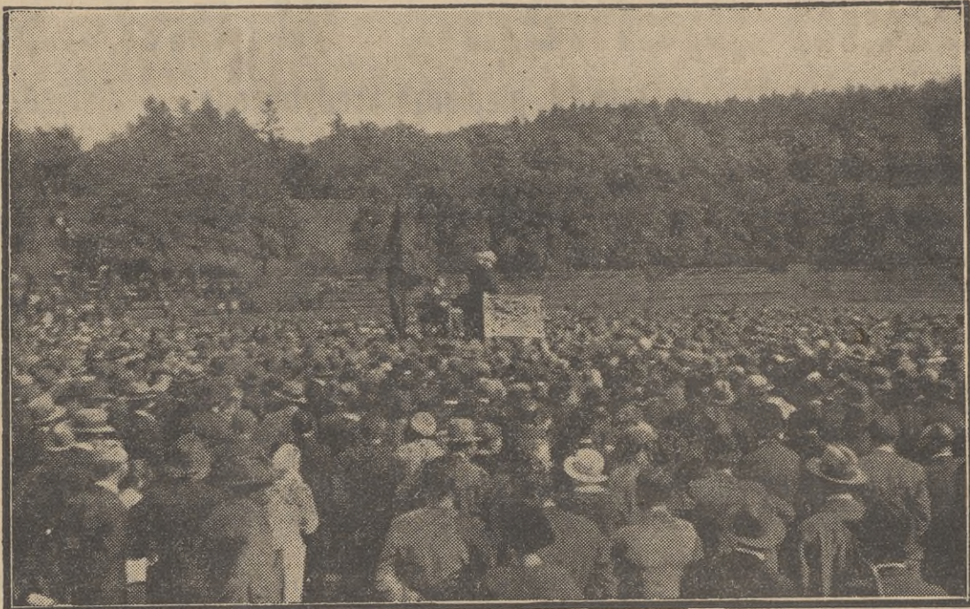
Olbrymia manifestacja robotnicza we Lwowie, która zgromadziła około 10.000 uczestników. — Na trybunie tow. poseł Arciszewski.

Kasy chorych stały się za ery „sanacyjnej” jednym z największych przykładów „radosnej twórczości”. Tak, była radosna twórczość, która podreperowała finanse kilkunastu ludzi, ale utworzyła zastój w rozwoju samych instytucji, zrobiła z nich domenę biurokratyczną zamiast utrzymać ją na wysokości instytucji społecznej. Zestawienie 243:61 jest najwymowniejszym dowodem, do jakiej roli zepchnięto Kasy: do roli dojrzałej krowy dla protegowanych, a udreki dla ubezpieczonych. Kiedyś, gdy przyjdzie czas, sprawa Kas chorych będzie jednym z największych oskarżeń przeciw sanacji.